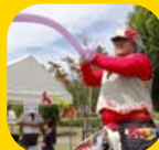
11日 風船匠じよにい