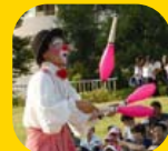
12日 クラウン アキオ