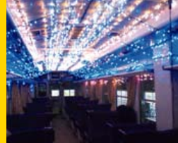
イベント列車内のイルミネーション