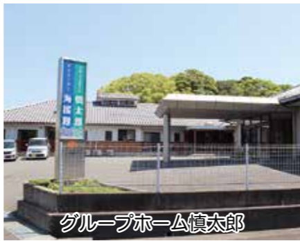
グループホーム慎太郎