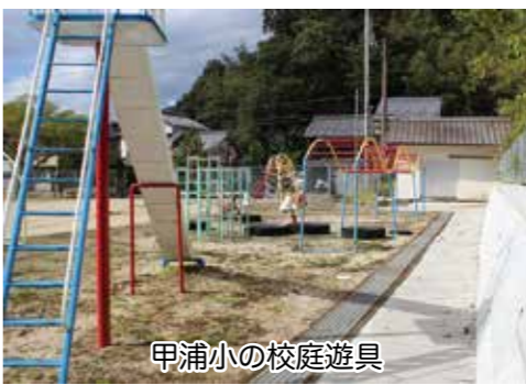
甲浦小の校庭遊具

答 国の指示で復興に向けて事前に高台移転やまちづくりの具体的な計画書を業者に委託して作成するものである。