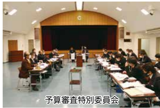
予算審査特別委員会