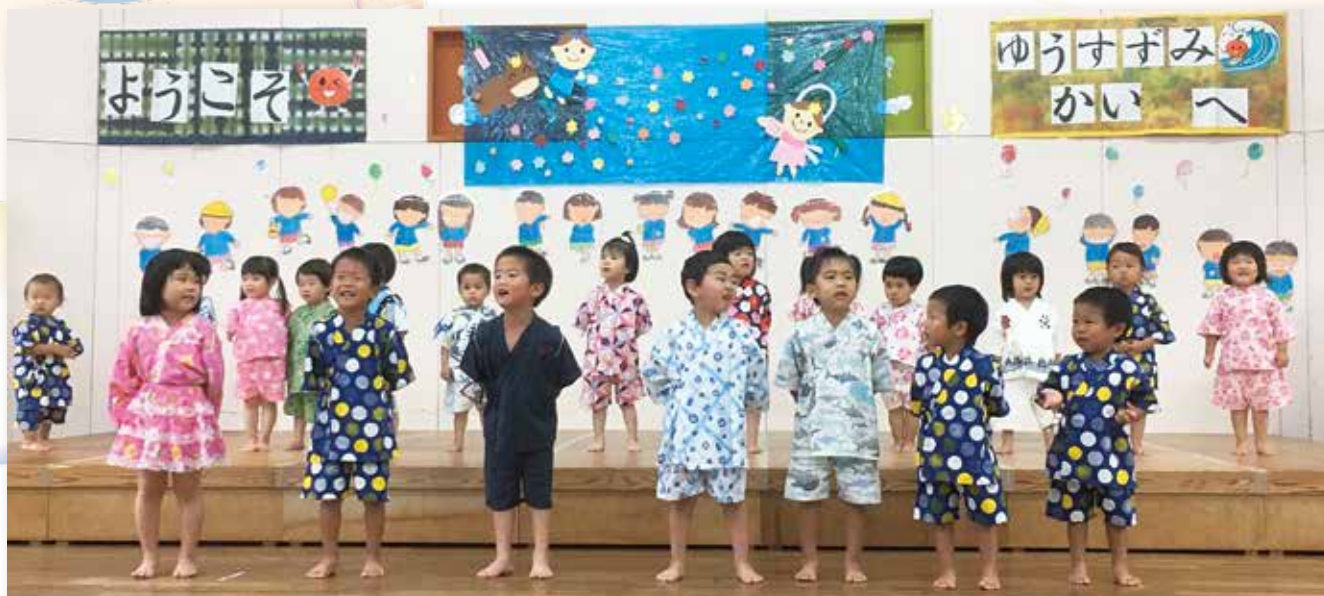
7/3(金) 甲浦保育園夕涼み会 (コロナ対策で園児と保護者のみで開催。)

発行：高知県東洋町議会 ☎(0887) 29-3398 発行人：議長 西岡尚宏 編集：広報編集委員会 印刷：米崎印刷株式会社