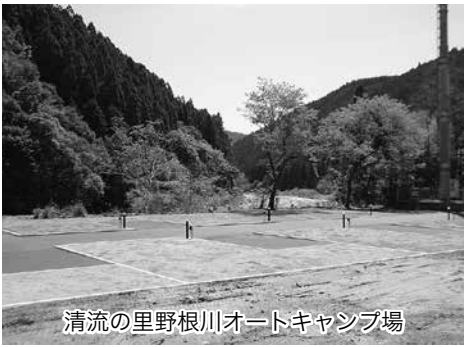
清流の里野根川オートキャンプ場

地区に新たに整備したキャンプ場、現在の白浜キャンプ場、生見サーフィンビーチのシャワー施設などを体験交流施設と位置付け新たに制定。