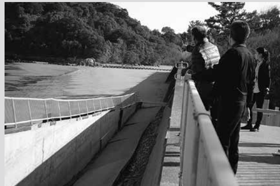
スロープの崩落を確認