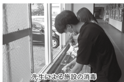
先生による施設の消毒

住民課長 職員、園児には保育園に来る前に自宅に検温し、登園後も検温を実施。園内に消毒液を設置し、消毒回数や手洗いを以前より増やしている。今回の補正予算でオゾン脱臭器を購入する予定である。