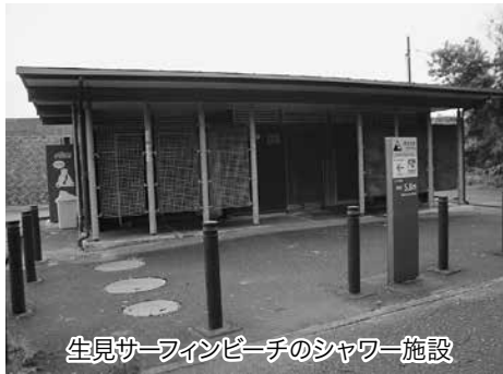
生見サーフィンビーチのシャワー施設

地区に新たに整備したキャンプ場、現在の白浜キャンプ場、生見サーフィンビーチのシャワー施設などを体験交流施設と位置付け新たに制定。