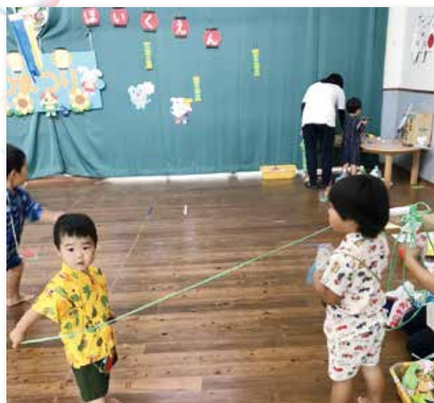
7/7(火) 银杏保育園七夕夏まつり (夕涼み会は、10月2日に延期。)