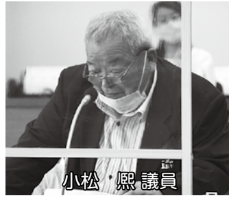
図 DMV車両3台が納入され、甲浦駅の工事は最終段階であるが、阿波海南駅では工事すら行っていないが、いつ開通か。

総務課長 DMV導入は、鉄道の維持、存続だけを目的とするものではなく、車両自体が観光資源となり、地域の観光振興はもとより、地域活性化など